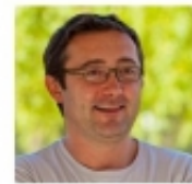
Tudor Giurgiu Regisor, Scenarist, Producator